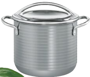
GEMÜSETOPF Ø 20 cm