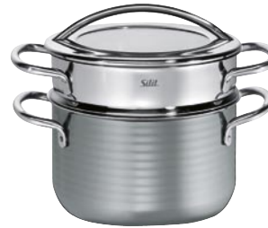
DÄMPFER MIT EINSATZ PASTATOPF MIT EINSATZ Ø 20 cm Einsatz einzeln erhältlich.