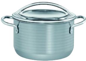
FLEISCHTÖPFE Ø 16, 20, 24 cm