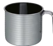
MILCHTOPF Ø 14 cm