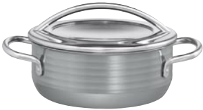
BRATENTÖPFE Ø 16, 20, 24 cm