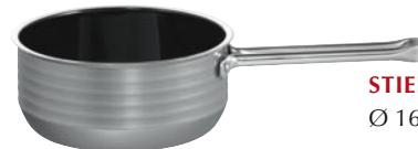
STIELKASSEROLLEN Ø 16, 20 cm